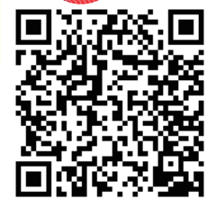
Chillout Studio HP の QR コード

体験などのご予約、お問い合わせは：メールでお願いします info@chilloutstudio.jp